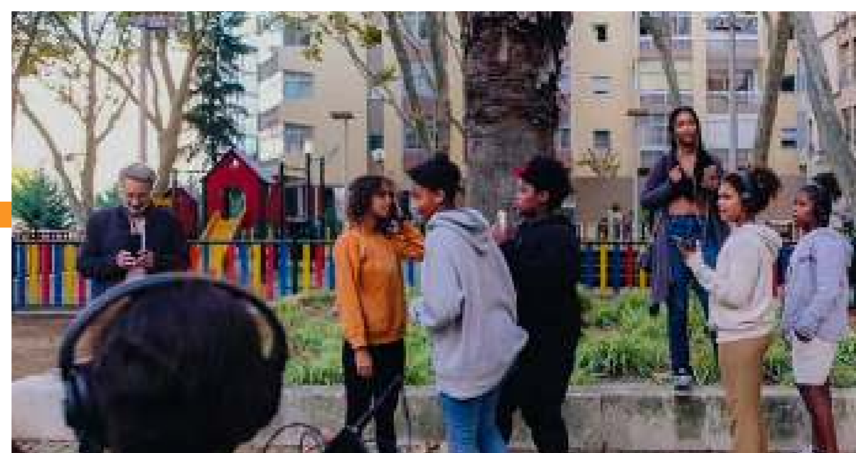
Grabación de los sonidos del barrio

Organizaciones: Universidade Nova de Lisboa Localización: Barrio de Rego, Lisboa Fecha: Enero - Septiembre de 2022