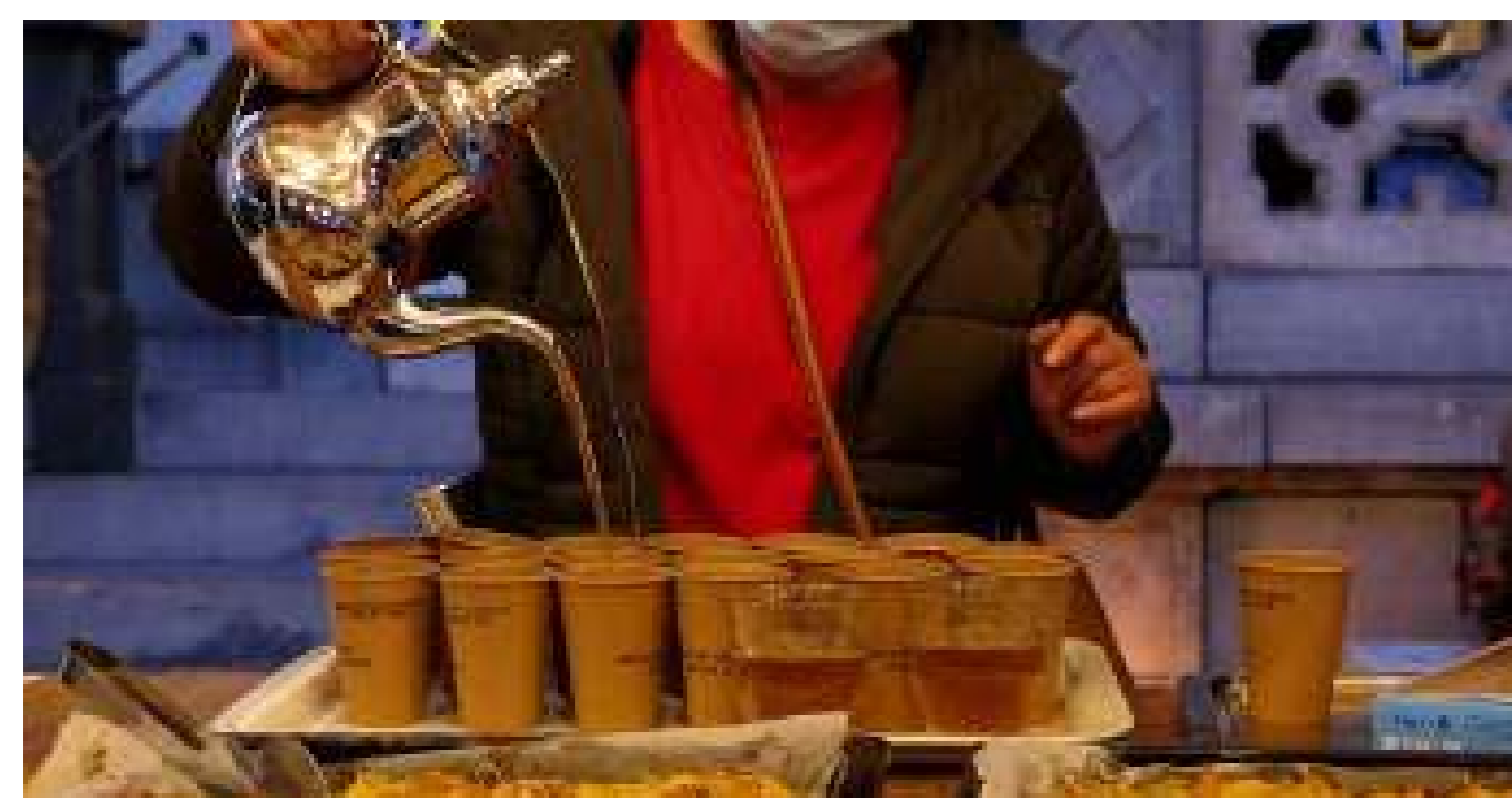
Una cena comunitaria con comida turca.

Organizaciones: Alive Architecture y Departamento de Arquitectura, KU Leuven Localización: Distrito de Schaerbeek, Bruselas Fecha: Octubre de 2020