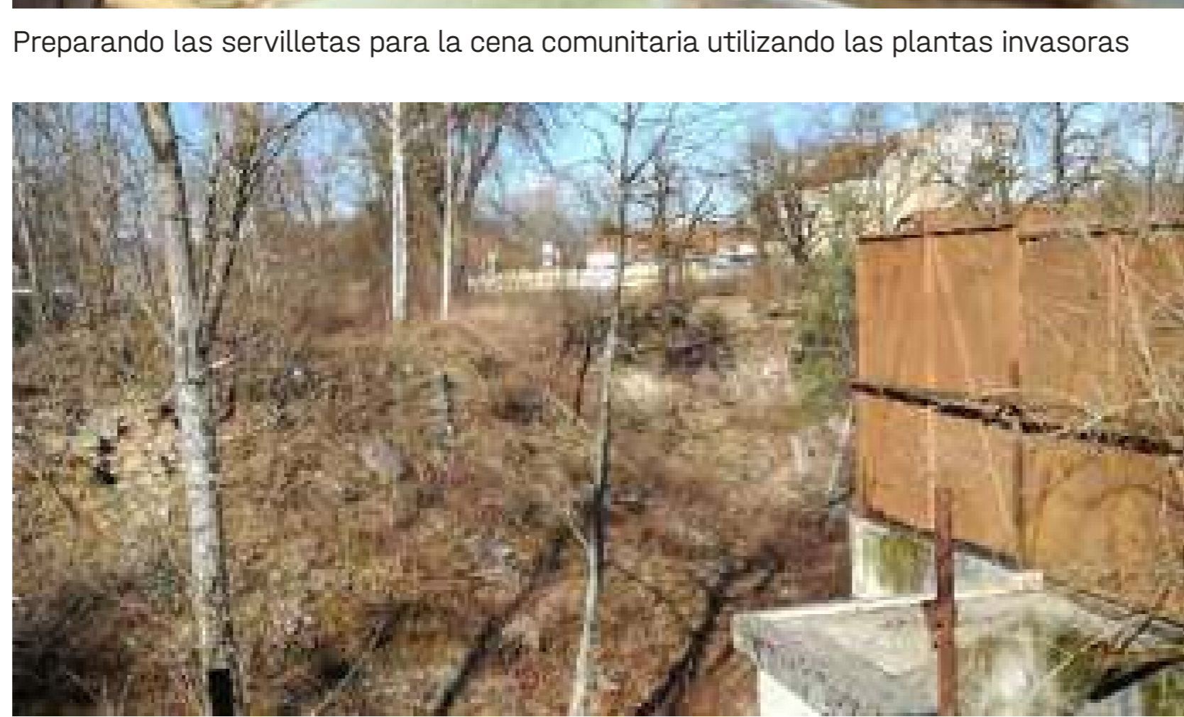
Un entorno natural para transformarlo en un lugar