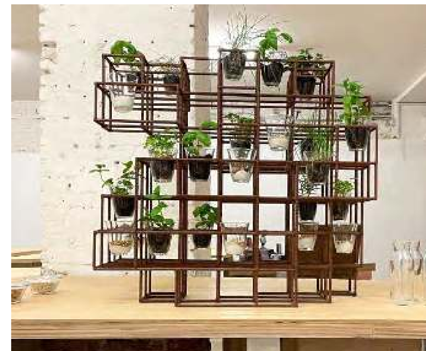
Instalación en la Bienal de Venecia

Organizaciones: Urban Gorillas, Alive Architecture, City Space Architecture y Prostorož Localización: Pabellón de Chipre, Bienal de Venecia Fecha: Octubre de 2021