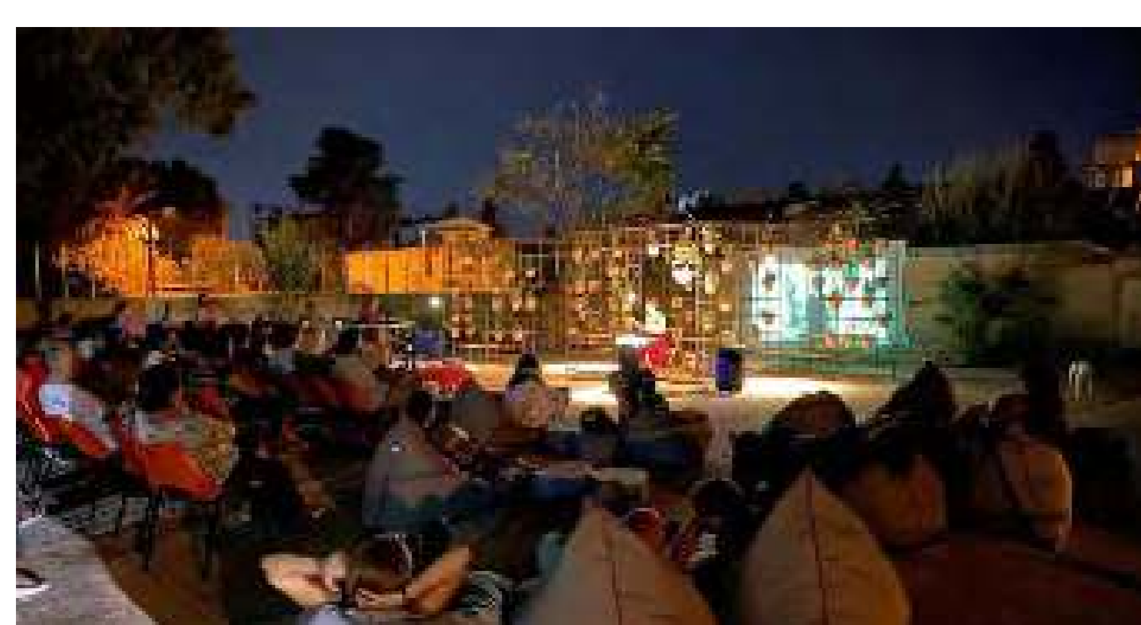
El Jardín Vertical transformó la plaza en un lugar vibrante

Organizaciones: Urban Gorillas Localización: Barrio de Kaimakli, Nicosia Fecha: Julio - Septiembre 2020