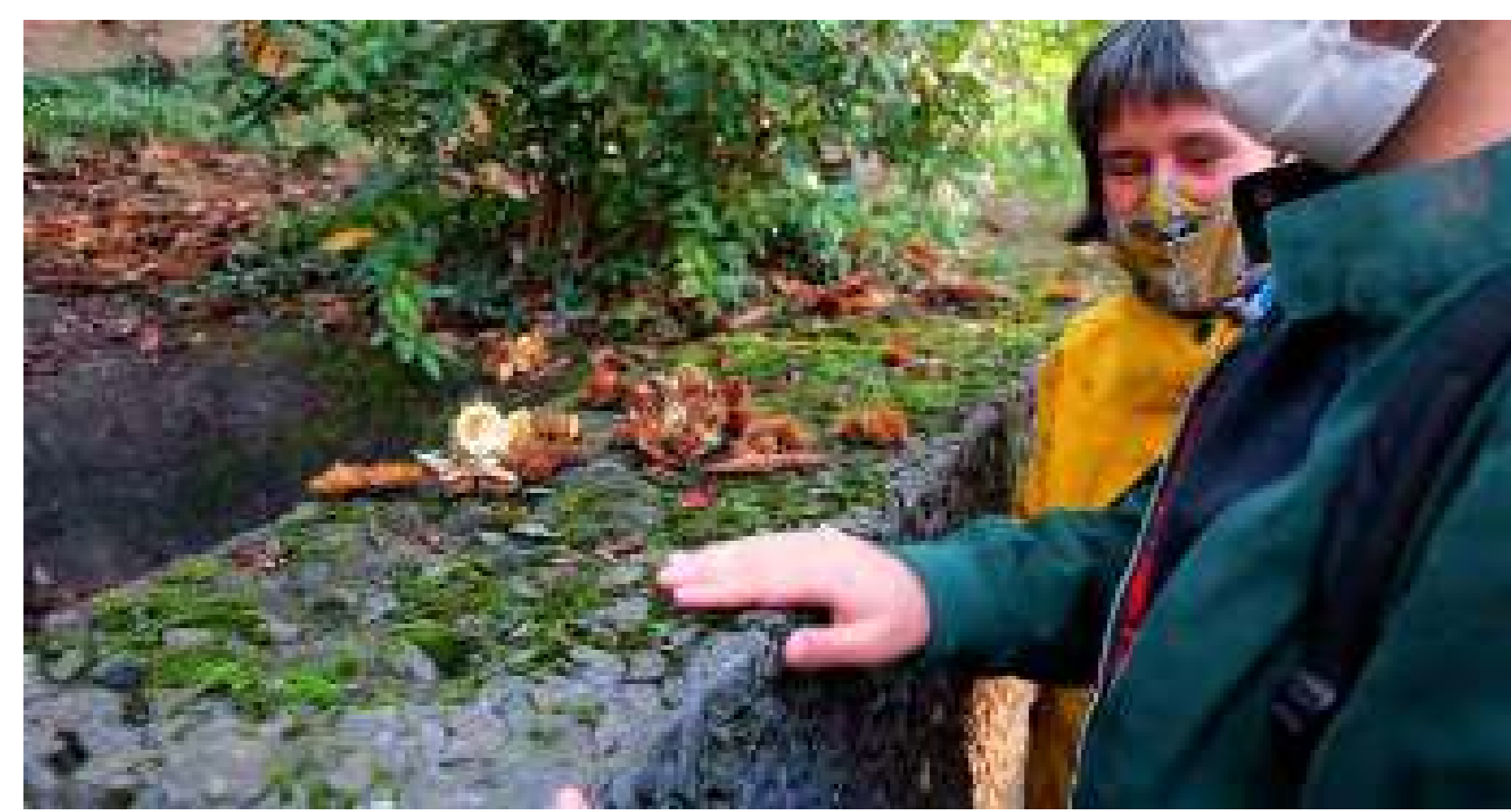
Reflexionando sobre la experiencia del paseo sensorial.