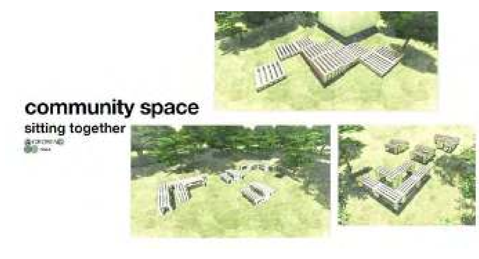
Crear un lugar en la naturaleza y con la naturaleza

Organizaciones: Facultad de Arquitectura, Universidad de Liubliana y Prostorož Localización: "Krater", barrio de Bežigranski Dvor, Liubliana Fecha: Agosto de 2020