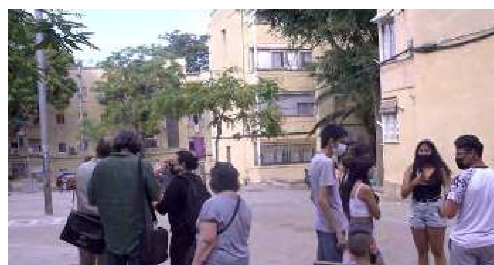
sentido de pertenencia