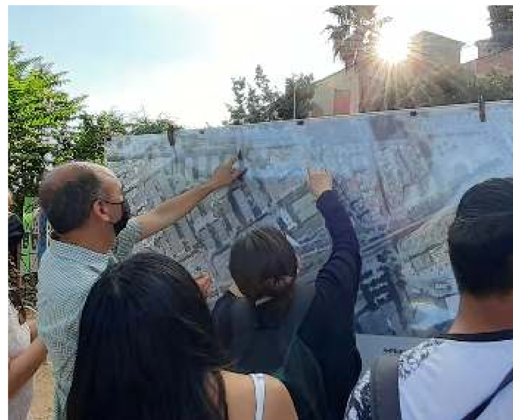
Paseo por el barrio de La Florida con residentes de distintas edades y grupos sociales

Organizaciones: Escuela de Arquitectura La Salle Localización: Barrio de La Florida, L'Hospitalet de Llobregat (Barcelona) Fecha: Junio 2021