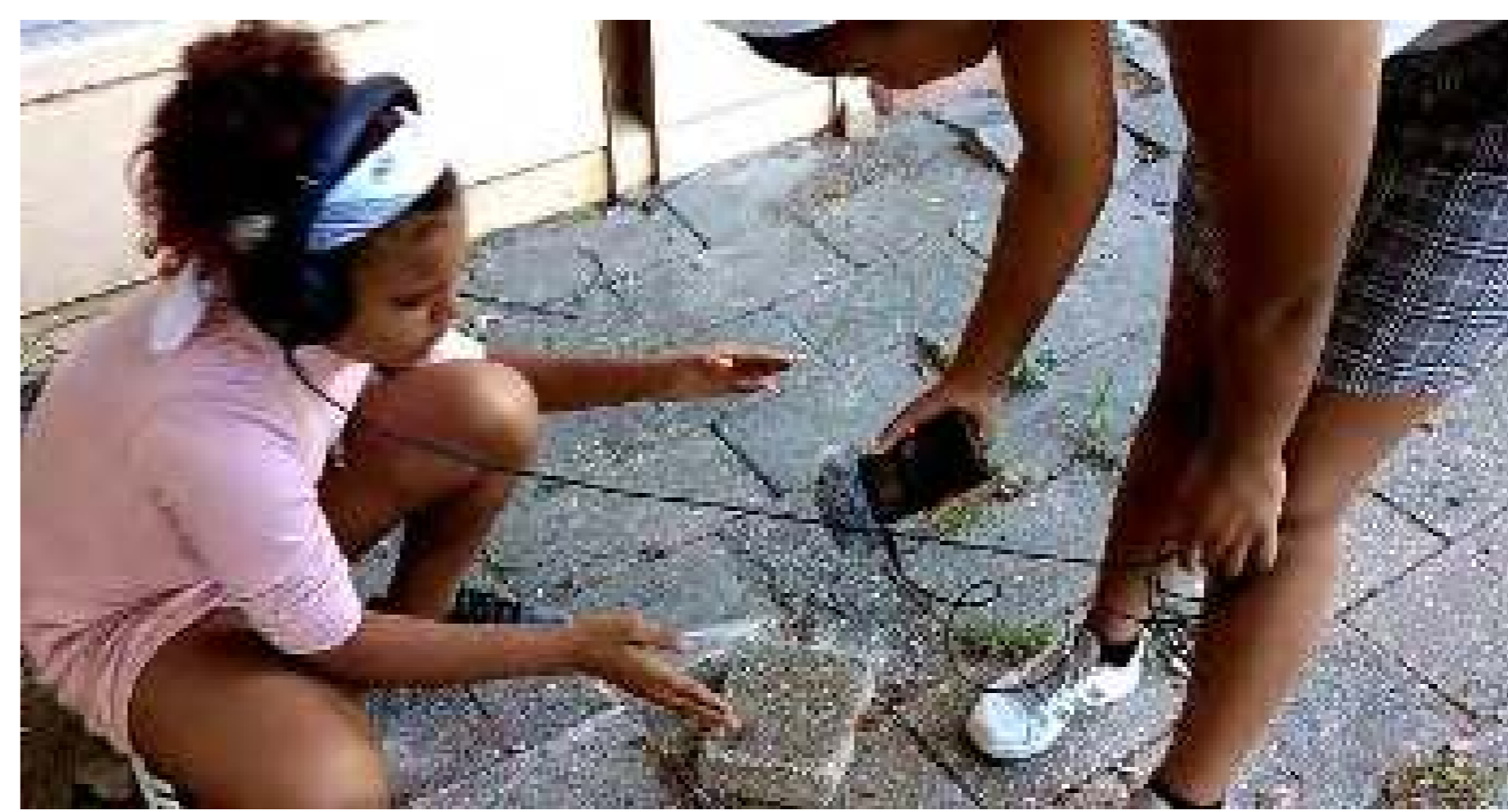
Grabación de los sonidos del barrio