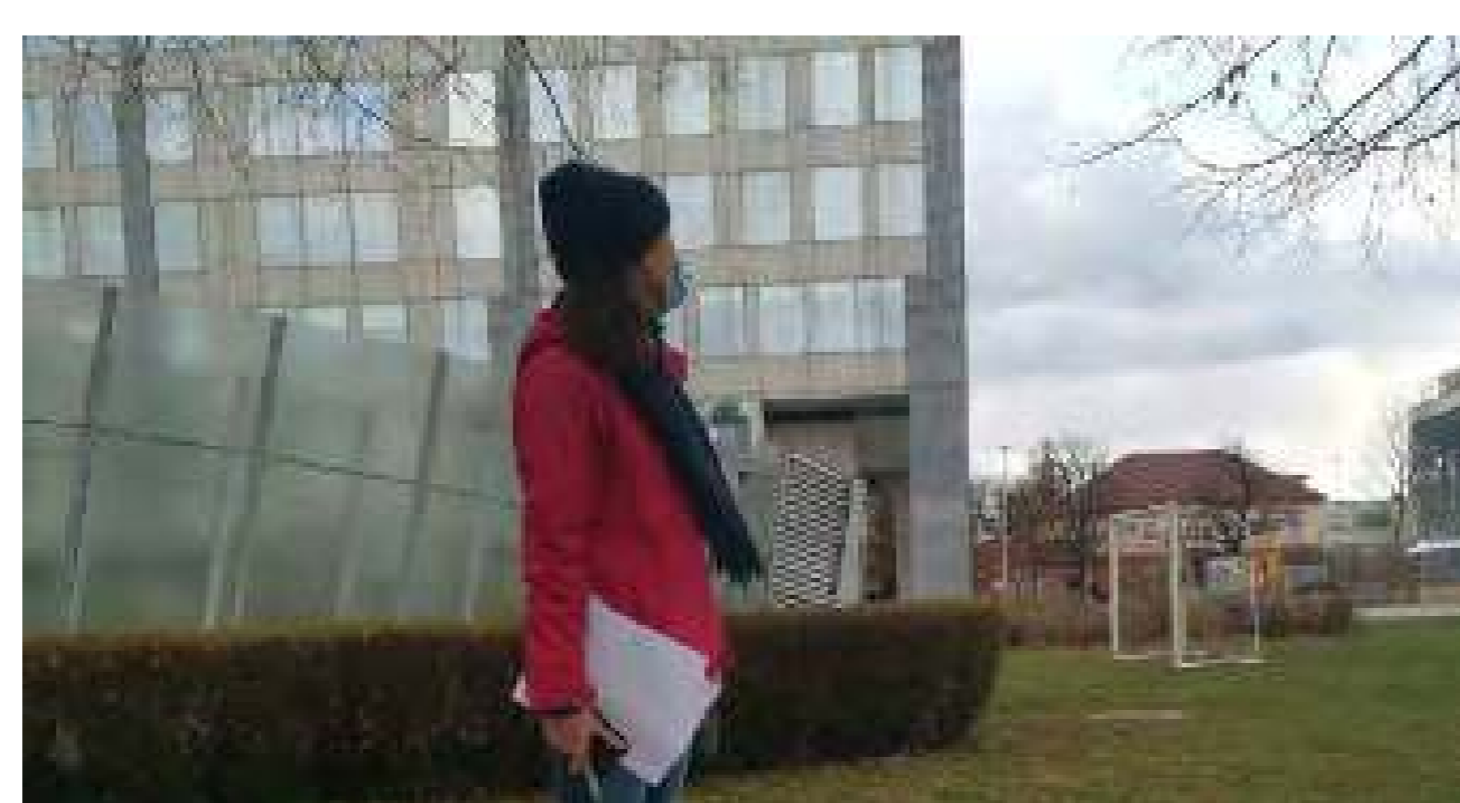
Los alumnos exploran los callejones del barrio