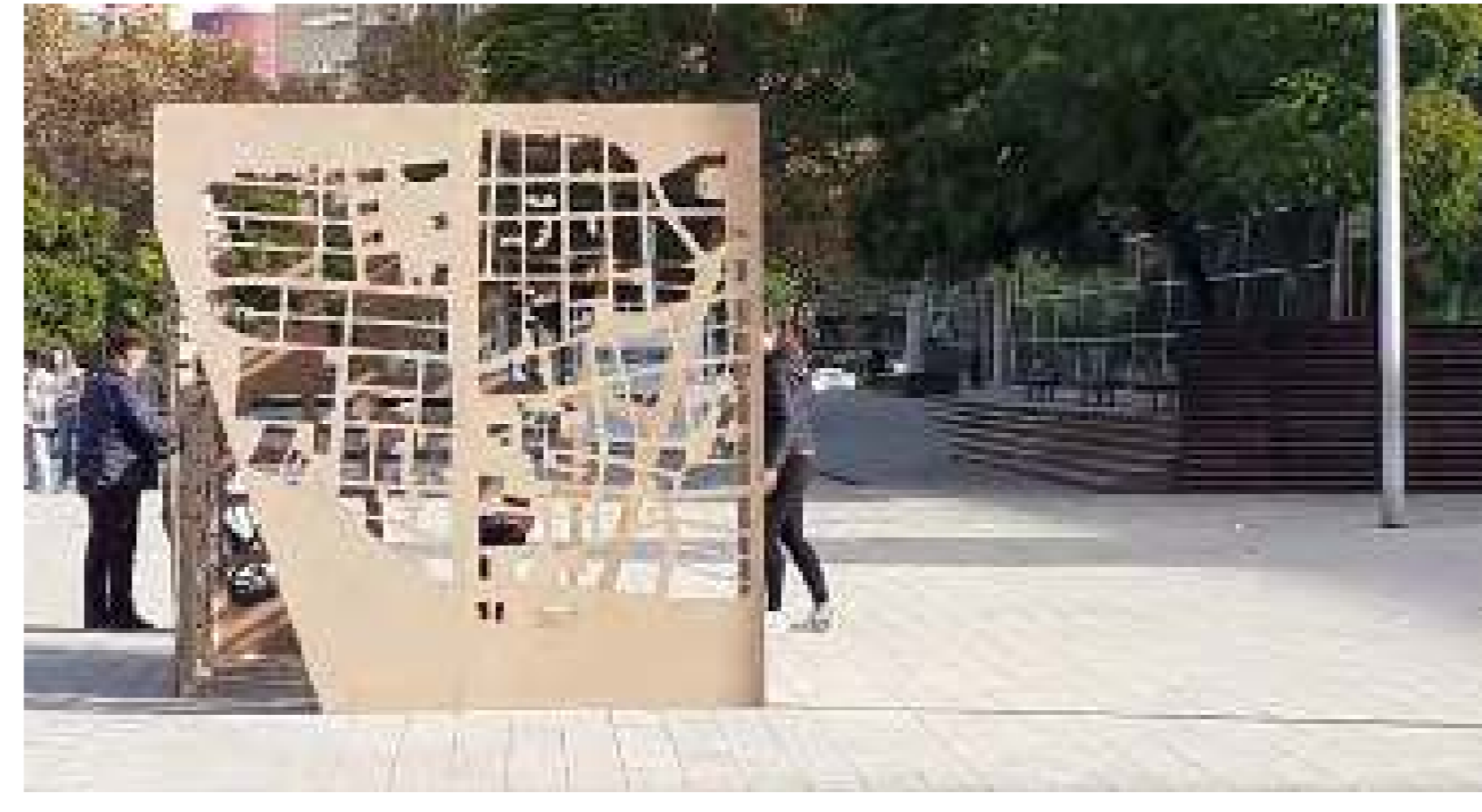
"Llenar el vacío", de Anna Trasserra, estudiante de la Escuela de Arquitectura La Salle