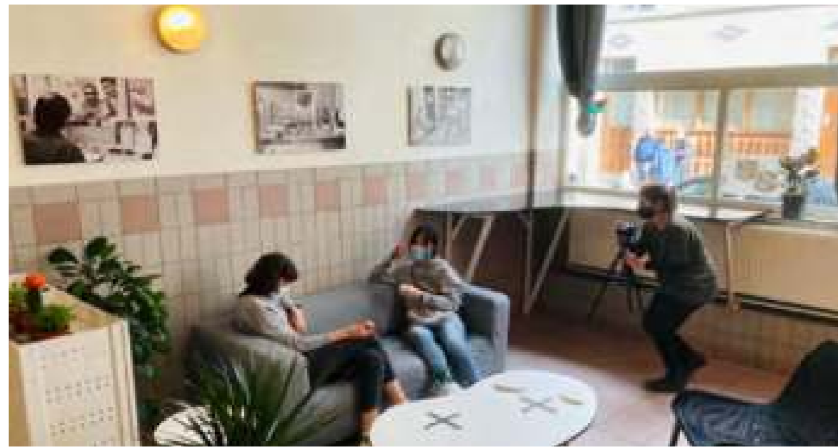
El albergue se renueva con mobiliario nuevo

Organizaciones: Departamento de Arquitectura, KU Leuven Localización: Albergue Bodegem Foyer, Bruselas Fecha: Abril - Mayo 2021