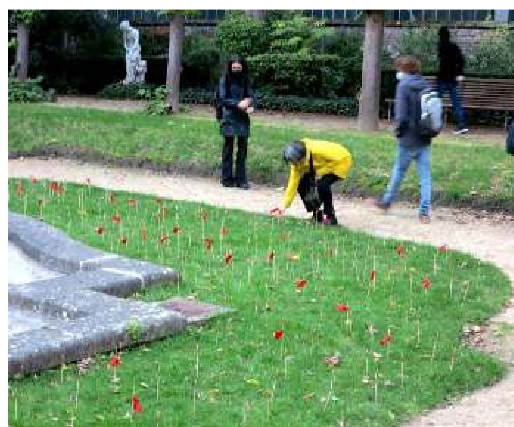
Tras el paseo, se dejaron huellas de las reflexiones.