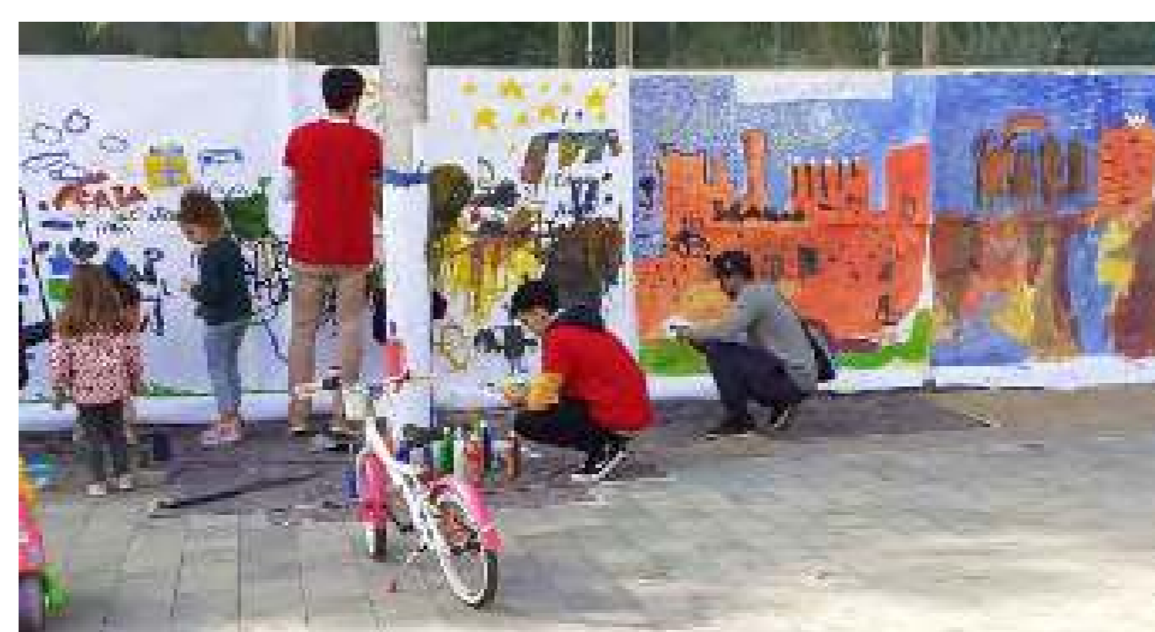
Taller de pintura y dibujo para niños organizado por PlayART