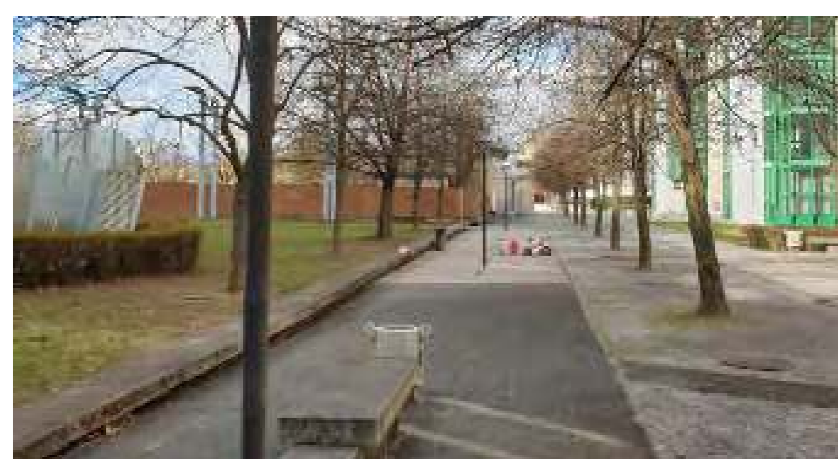
Los alumnos exploran los callejones del barrio