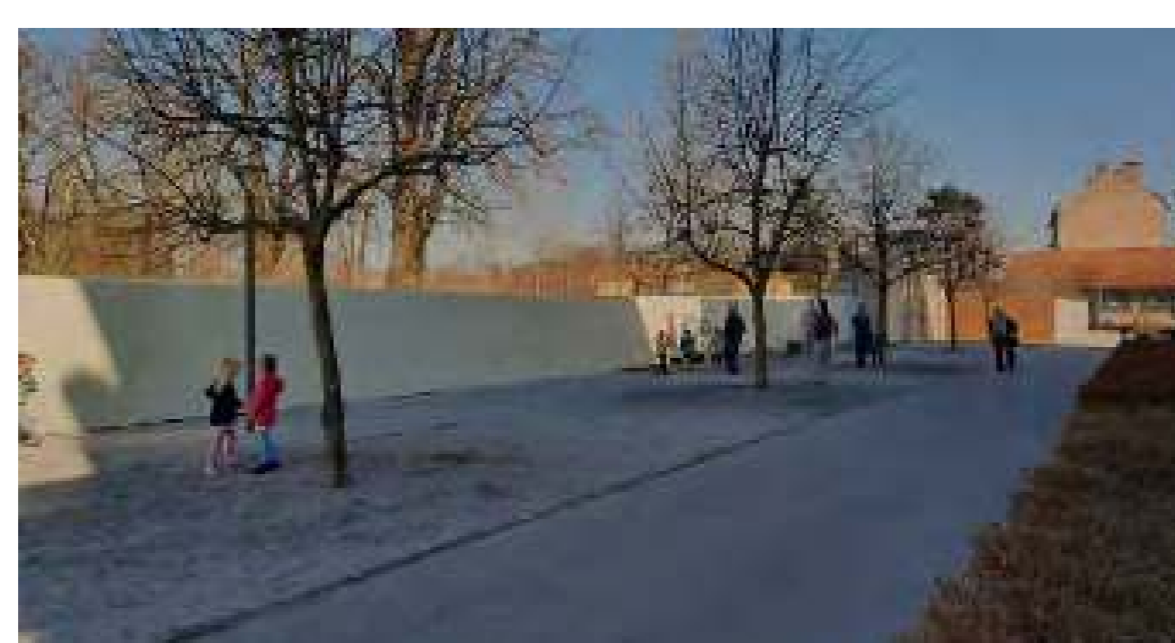
Los alumnos exploran los callejones del barrio

Organizaciones: Facultad de Arquitectura, Universidad de Liubliana y Prostoroz Localización: Barrio de Bežigrjski Dvor, Liubliana Fecha: Marzo - Mayo 2021