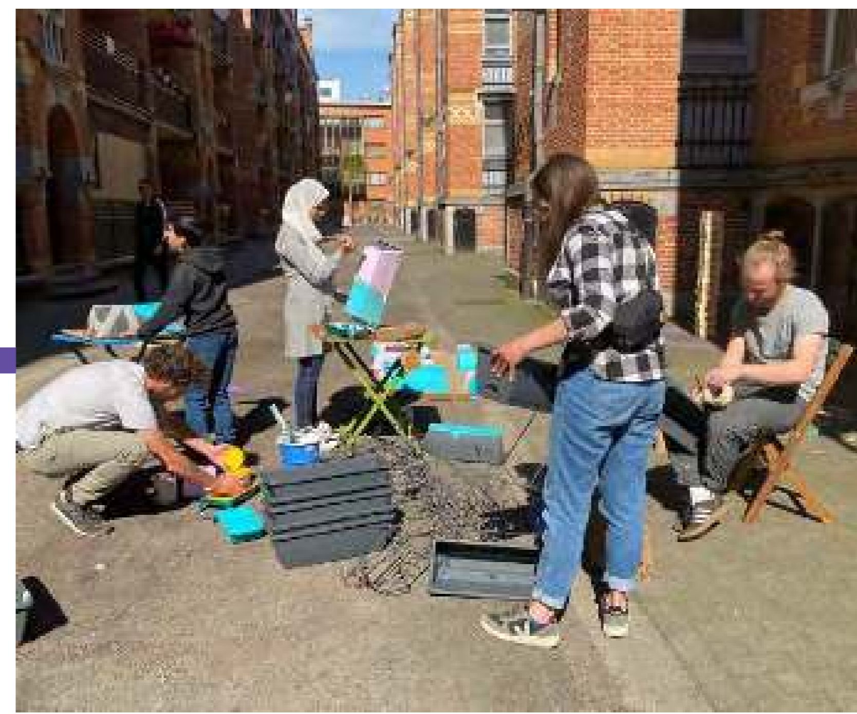
Pintando las jardineras del balcón.

Organizaciones: Alive Architecture, en colaboración con BRAVVO Localización: Barrio de Marolles, Bruselas Fecha: Abril - Junio de 2022