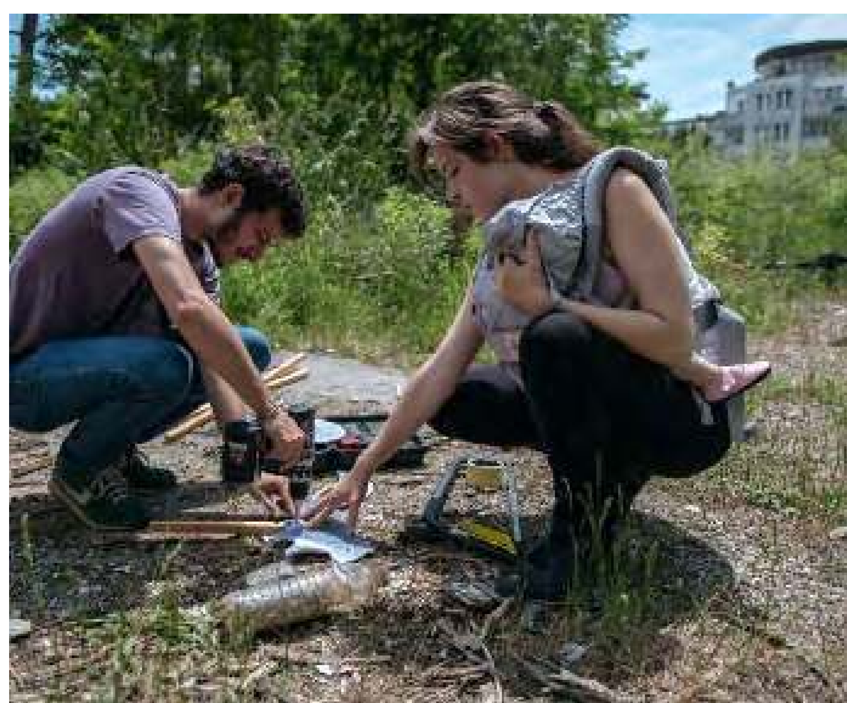
Pintando la valla que rodea el solar