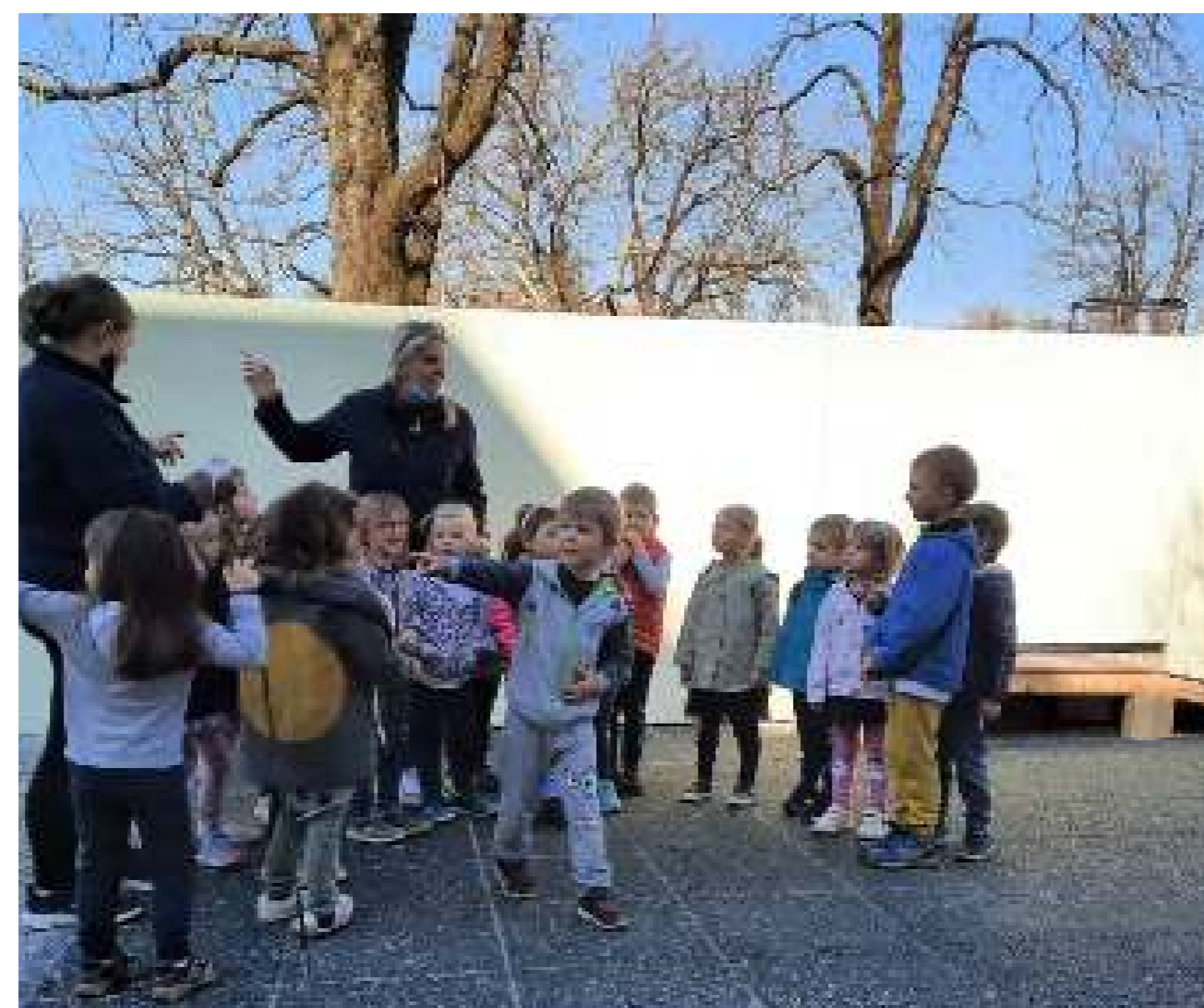
Observando el comportamiento y el juego de los niños