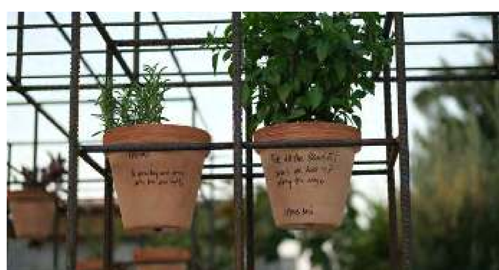
Creación de un jardín comunitario de hierbas aromáticas.

Organizaciones: Urban Gorillas Localización: Barrio de Kaimakli, Nicosia Fecha: Abril - Julio 2022