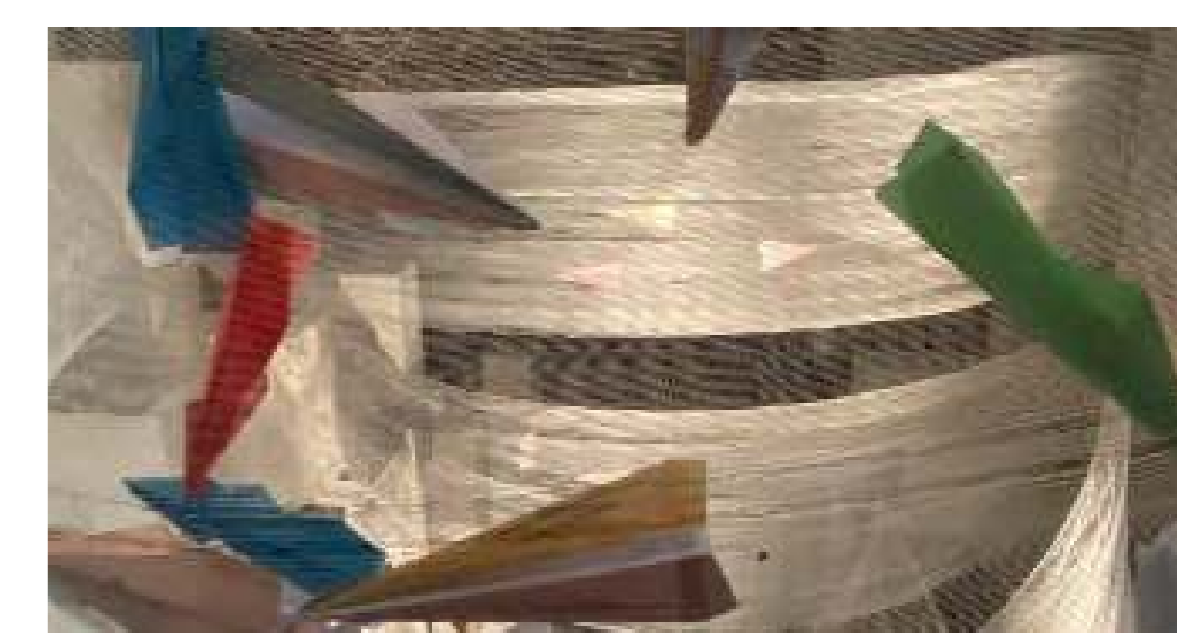
Instalación en City Plaza, Nicosia. Deseos escritos en piezas de papiroflexia

Organizaciones: Urban Gorillas Localización: City Plaza, Nicosia Fecha: Octubre - Diciembre de 2021