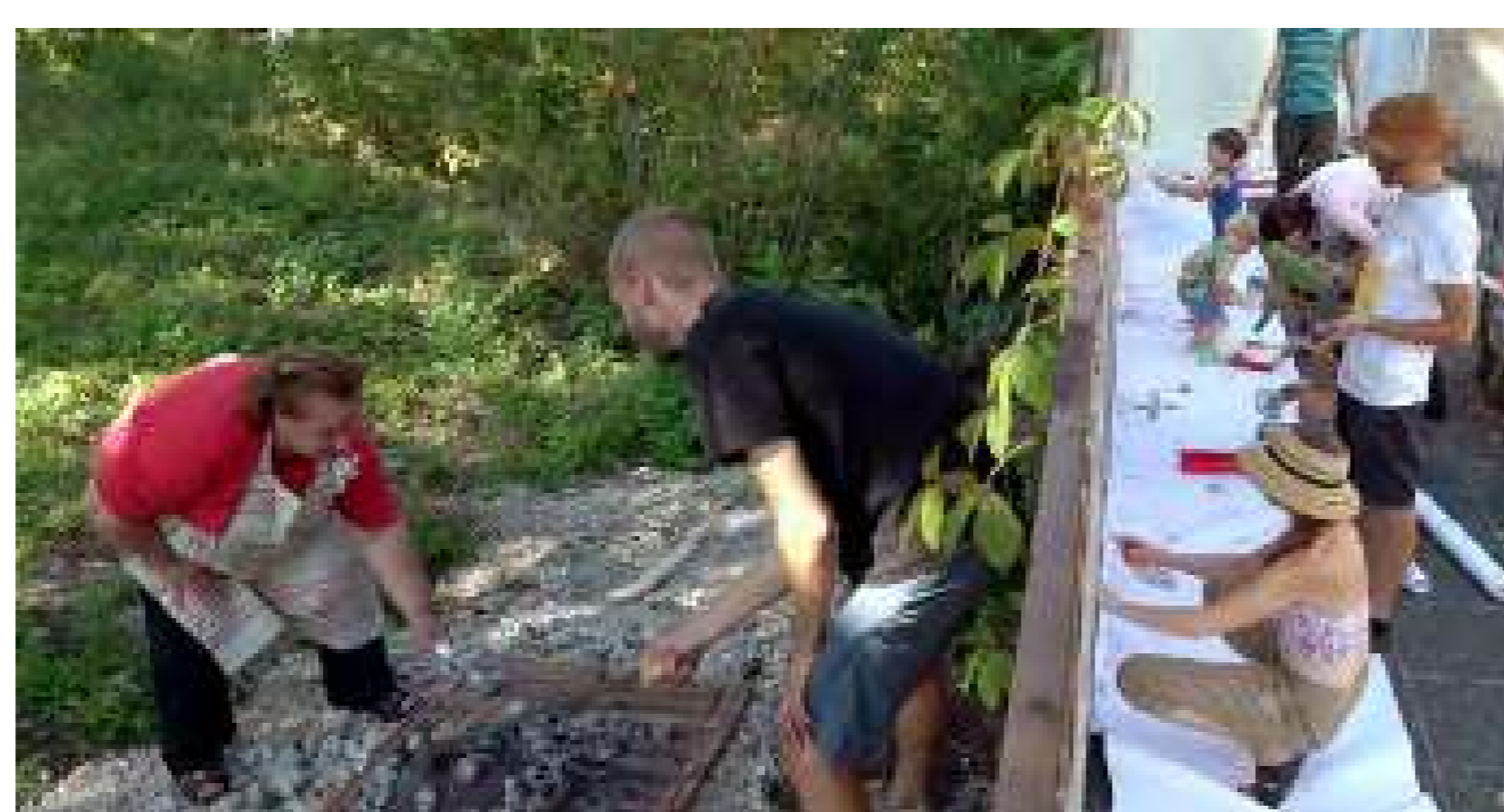
Buscando plantas y pintando la valla con los residentes