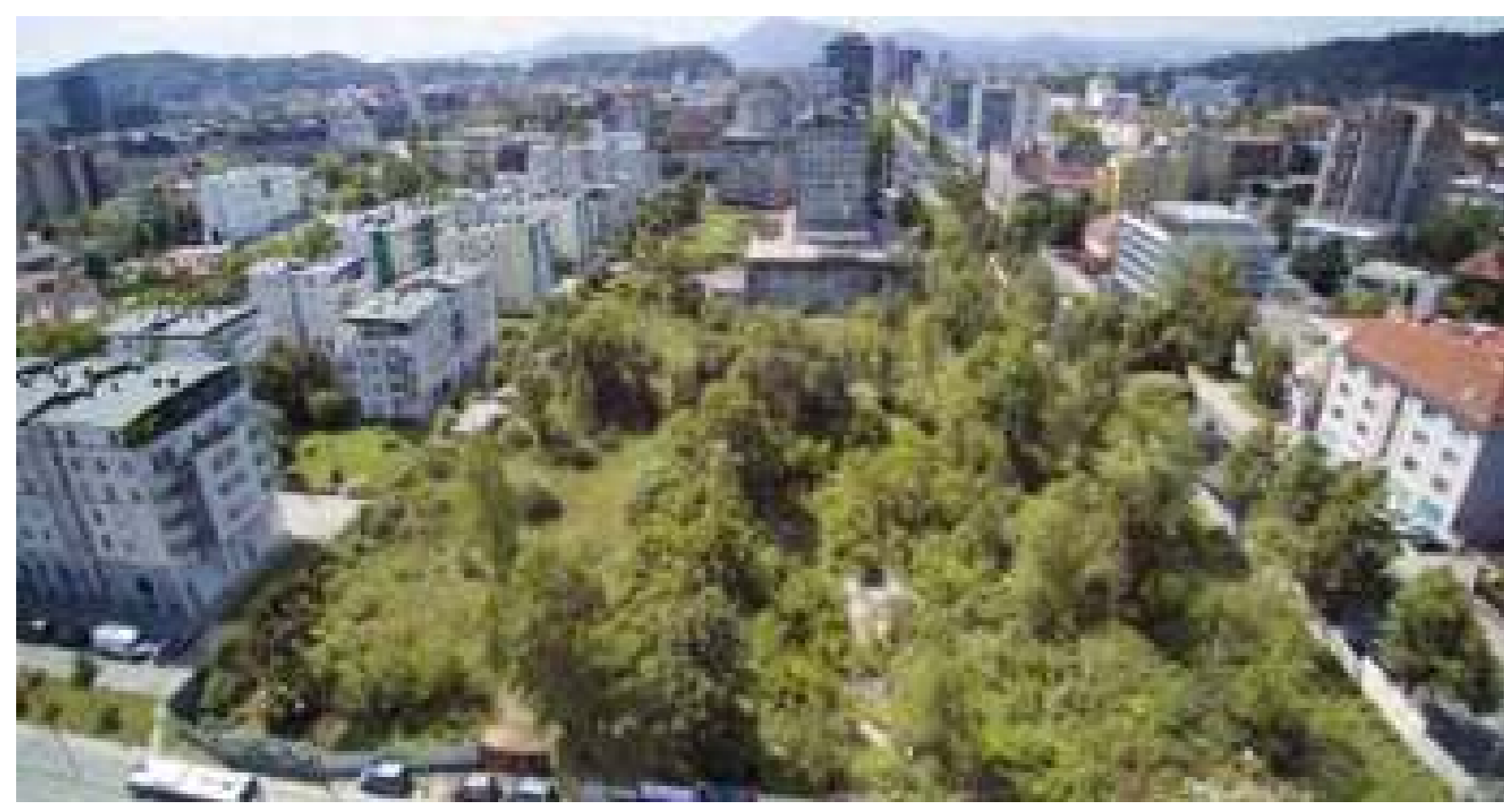
Un lugar oculto. Barrio de Bežigranski Dvor, Ljubljana