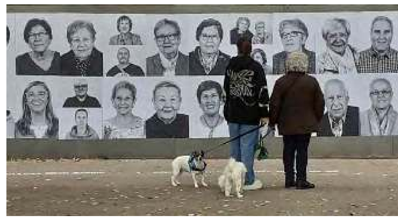
"El valor de Bellvitge", de los alumnos del Institut Bellvitge (ganador de un premio del público)