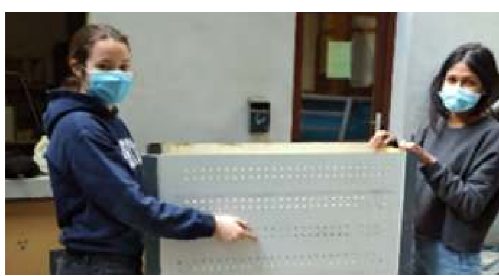
Muebles nuevos montados in situ