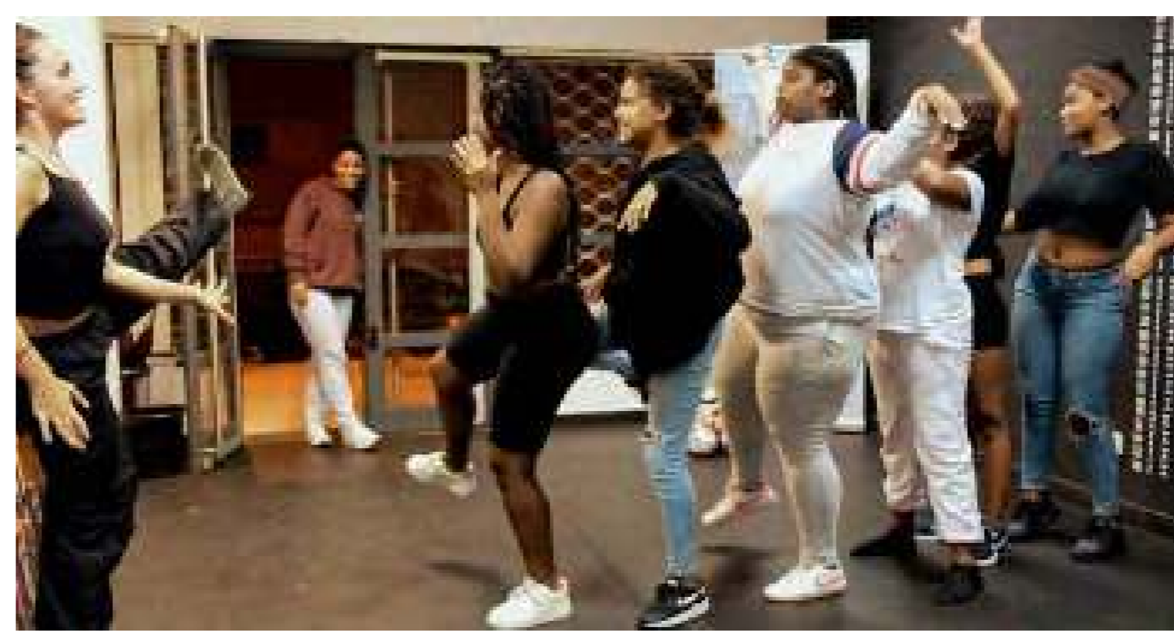
Co-creación de una coreografía para actuar en un flash mob