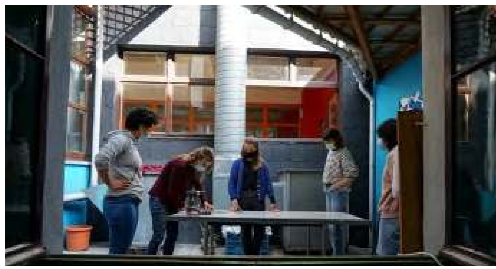
Estudiantes aprenden carpintería en el albergue

"El sentido del lugar es lo que diferencia a una ciudad de otra, pero el sentido del lugar es también lo que hace que merezca la pena cuidar nuestro entorno físico".