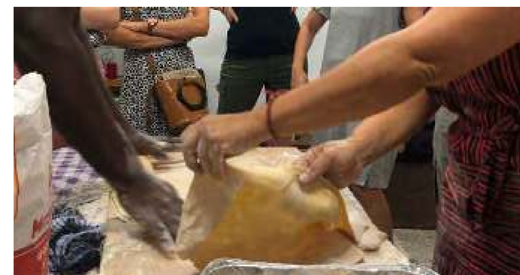
Taller de elaboración de tallarines seguido de una cena en el espacio cultural local Thalami.

Organizaciones: Urban Gorillas Localización: Barrio de Kaimakli, Nicosia Fecha: Septiembre de 2020