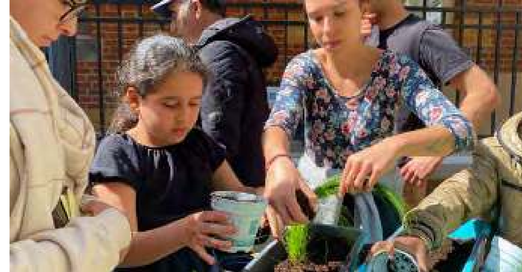
Plantando plantas con los niños del barrio.