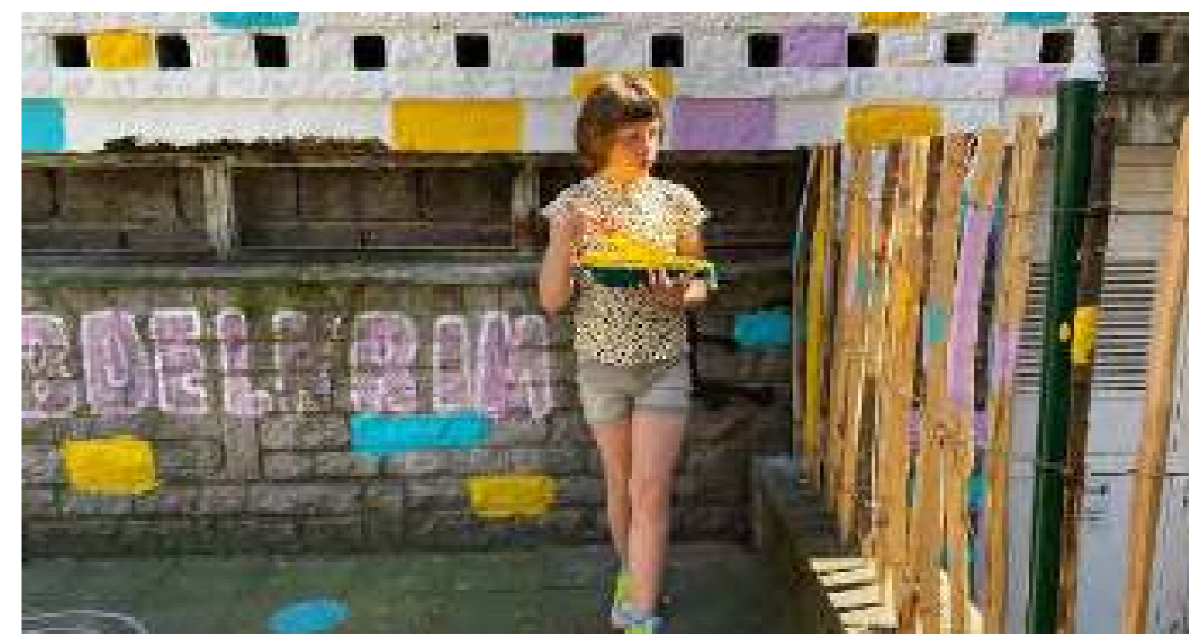
Niños pintando la valla recién instalada.