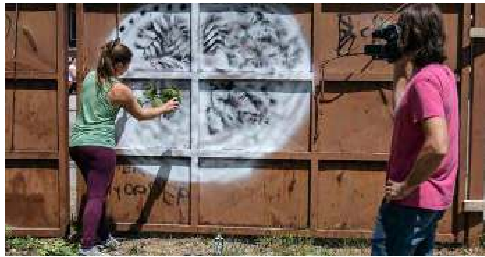
Construyendo la propuesta en el solar

Organizaciones: Facultad de Arquitectura, Universidad de Liubliana y Prostorž Localización: "Krater", barrio de Bežigranski Dvor, Liubliana Fecha: Marzo - Junio 2020