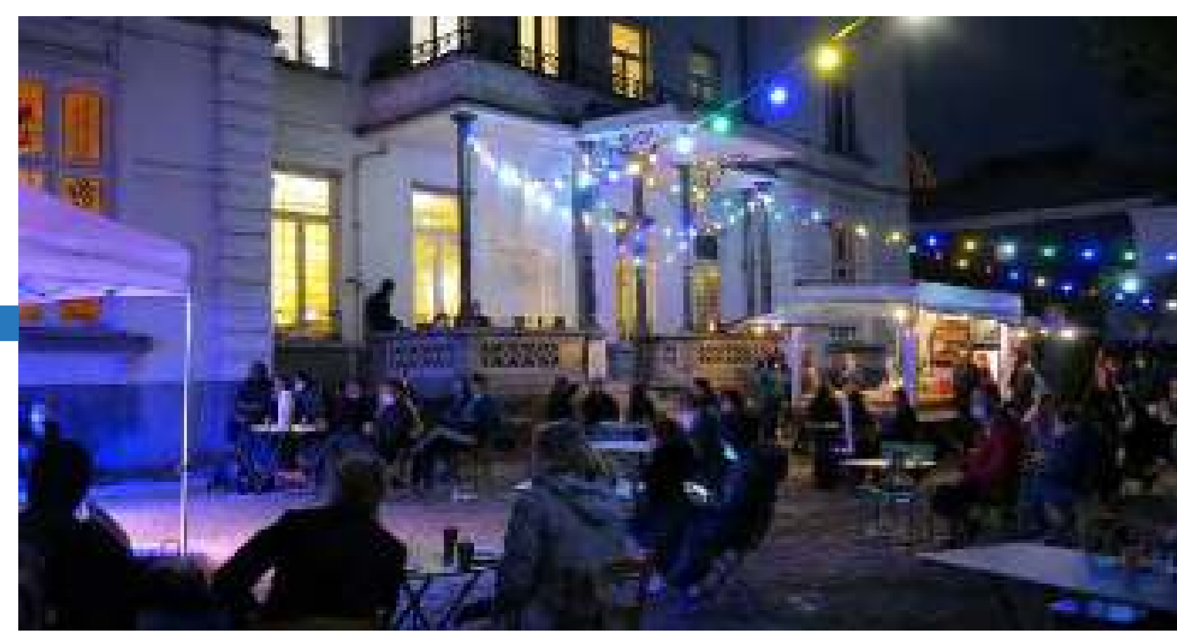
Patio de la Maison des Arts durante la cena y el concierto.