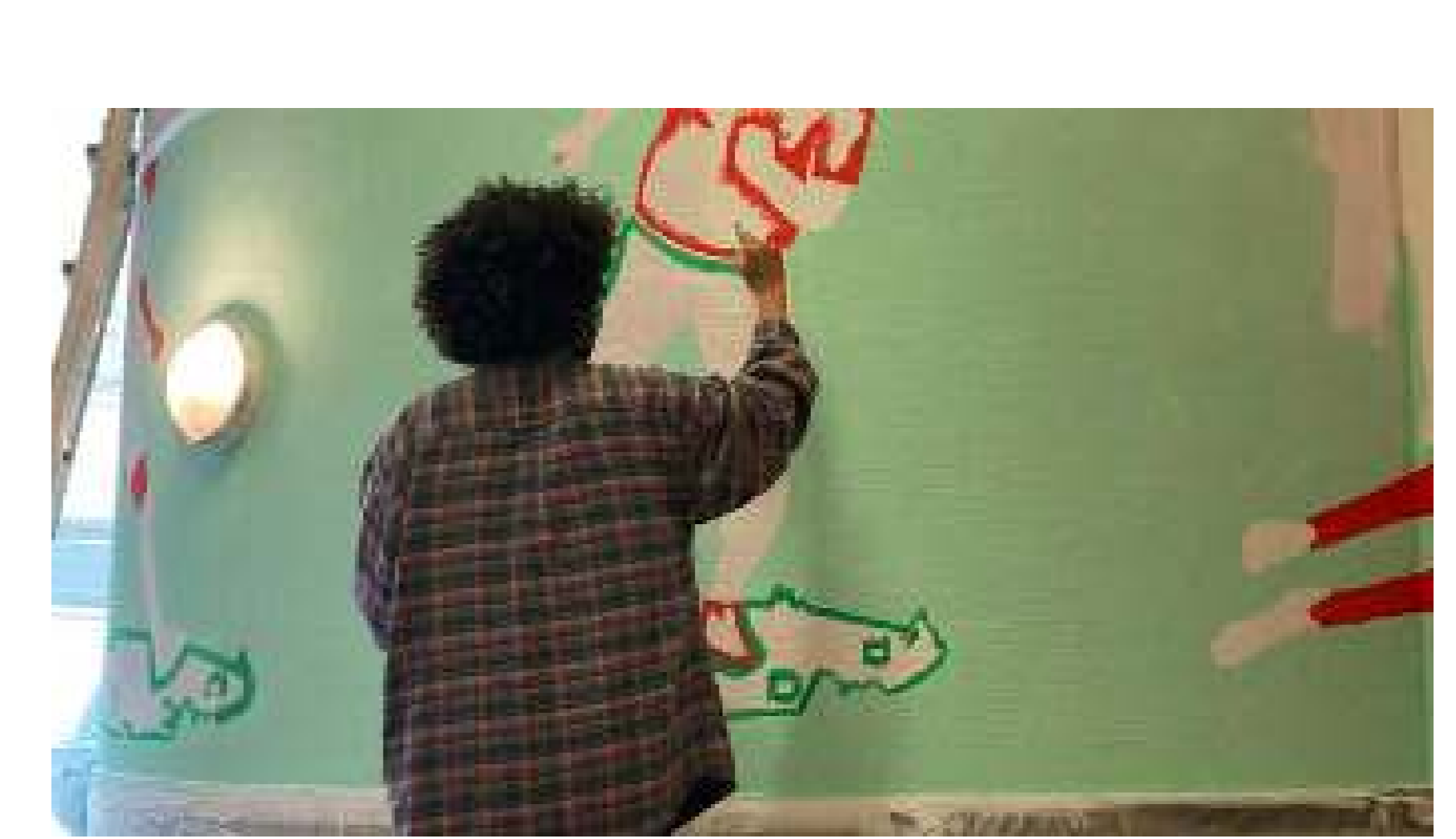
Estudiantes y residentes infundiendo vitalidad al albergue

Organizaciones: Departamento de Arquitectura, KU Leuven Localización: Albergue Bodegem Foyer, Bruselas Fecha: Noviembre 2021