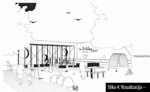
Slika 4: Vizualizacija – »Skriti prostor se razkrije«.

Semestrska delavnica AHiddenPlace na Fakulteti za arhitekturo Univerze v Ljubljani je potekala v sklopu projekta A-Place. Študenti so skozi proces raziskovanja prostora, spoznavanja s potrebami potencialnih uporabnikov in poglobljenega opazovanja naravnih danosti gradbene jame pri Bežigradskih dvorih razvili idejne projekte, ki na prostoru mirujočega gradbišča ustvarjajo prostor sobivanja med človekom in naravo, na katerem bo začasno deloval tudi kolektiv Trajna.