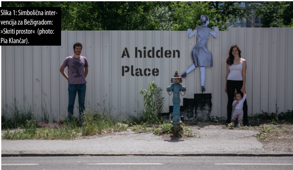
Slika 1: Simbolična intervencija za Bežigradom: »Skriti prostor«.